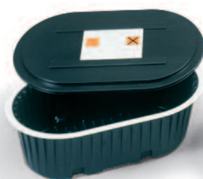
Entsorgungswanne mit Deckel